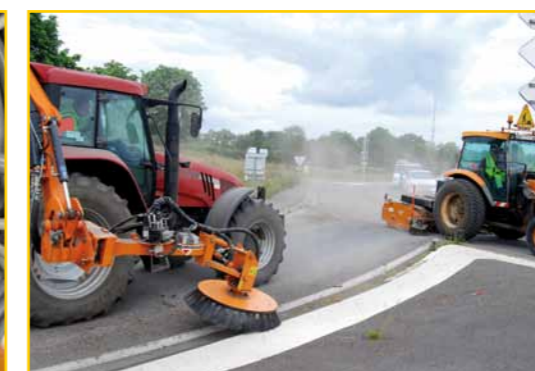
Désherbage îlot + Balayeuse ramasseuse TURBONET