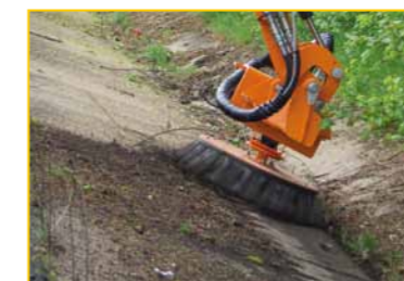
Désherbage cunette en béton