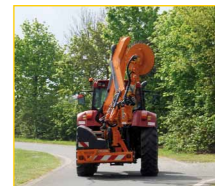
Machine compacte au transport