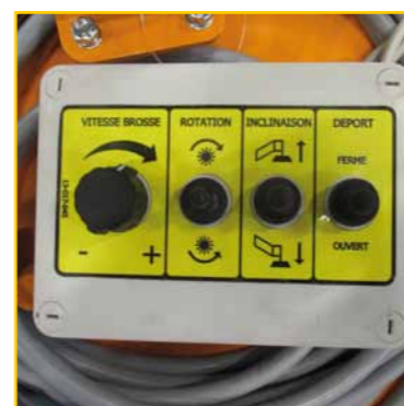
Commandes en cabine