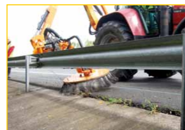
Désherbage sous glissières