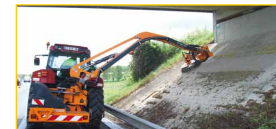
Désherbage à la verticale