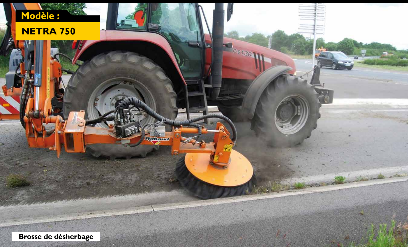
Brosse de désherbage