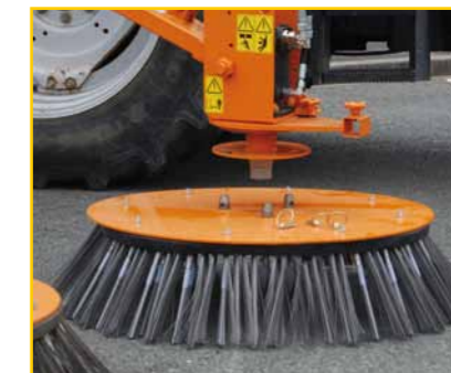
Montage / Démontage rapide des brosses sans outils