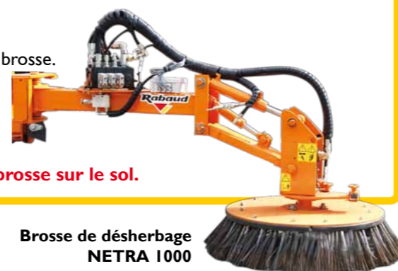
Brosse de désherbage NETRA 1000